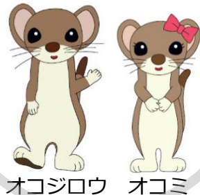
オコジロウ オコミ